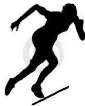
Figura 01. Largada do teste de 12 min.