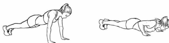
Figura 02. Execução do teste de flexão de braço para ambos os sexos.